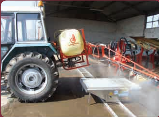
Slika 3. Sprej skener za kontrolu poprečne distribucije (Turija, 2015.)