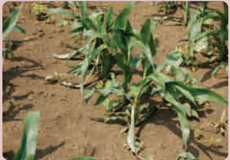
Slika 2. Posledice primene okvašivača nakon faze sedmog lista kukuruza

Herbicidi sa hormonskim delovanjem zahtevaju posebnu pažnju pri primeni jer svaka greška (kao što je primena u kasnijoj fazi porasta kukuruza) dovodi do posledica koje se manifestuju lomljenjem biljaka pri vetru, uvijanjem listova u "trube" i sve to na kraju, kao posledicu ima smanjenje prinosa (slika 1. i 2.).