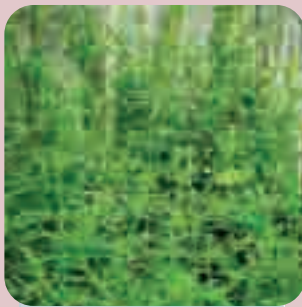
Galium aparinae (prilepača)