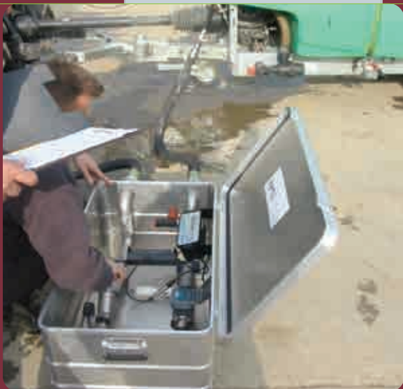
Slika 1. Merilo protoka pumpe (Čelarevo, 2009)

Kontrola kvaliteta rasprskivača podrazumeva kontrolu kapaciteta rasprskivača i kontrolu poprečne distribucije. Merilo kapaciteta rasprskivača može biti elektronsko