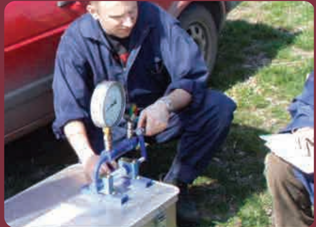
Slika 4. Manotester (Bačka Topola, 2010)

Dozvoljeno odstupanje očitane vrednosti između repnog manometra i manometra koji se kontroliše je 10%. Kod nabavke manometra proizvođači treba da vode računa da je prečnik manometra minimum 63 mm, da su podeoci na skali na svakih 0,2 bar, do vrednosti 5 bar, a za veće vrednosti podeoci mogu biti u opsegu od 1 bar.