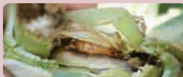
Ostrinia nubilalis (kukuruzni plamenac)