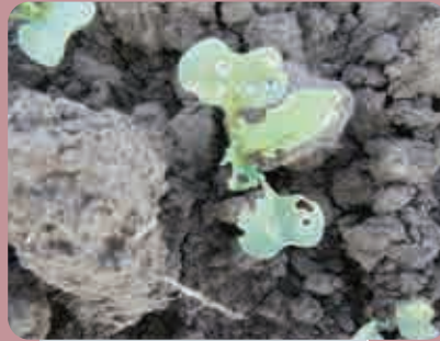
Oštećenja uljane repice od buvača