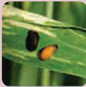
Lema melanopus (žitna pijavica)