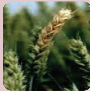
Fusarium graminearum (fuzarioza klasa pšenice)