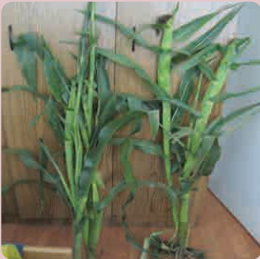
Slika 1. Simptomi fitotoksičnosti 2,4-D na biljkama kukuruza, kao posledica zakasnele primene herbicida, predoziranja i nepovoljnih vremenskih uslova.