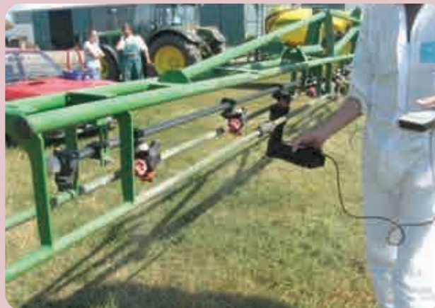
Slika 2a. Elektronsko merilo pojedinačnog kapaciteta rasprskivača (Novo Miloševo, 2011.)