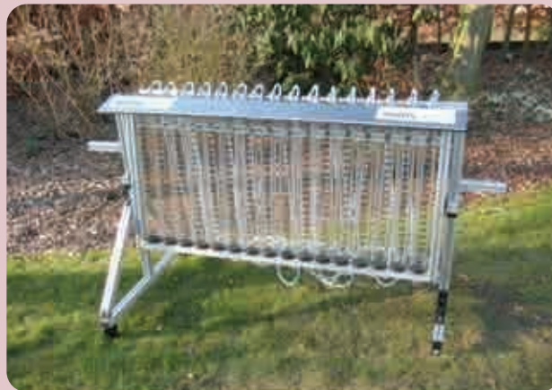
Slika 2b. Mehaničko merilo protoka većeg broja rasprskivača

namenjeno za proveru pojedinačnog protoka (Slika 2a.) ili je namenjeno za istovremenu proveru protoka svih rasprskivača (Slika 2b.), što je bitno kod kontrole orošivača. Pojedinačno merilo poseduje adaptere za sve tipove rasprskivača i memorijsku jedinicu za skladištenje 1.000 podataka.