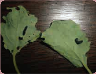
Oštećenja uljane repice od repičine lisne ose